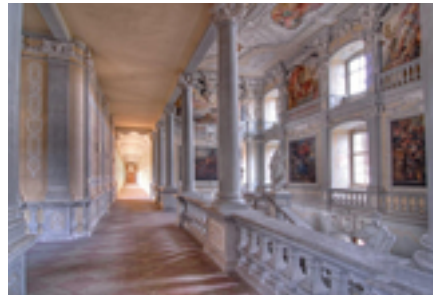
oben Luftbild Kloster Ebrach links Treppenhaus unten Autobahn- kirche Geiselwind